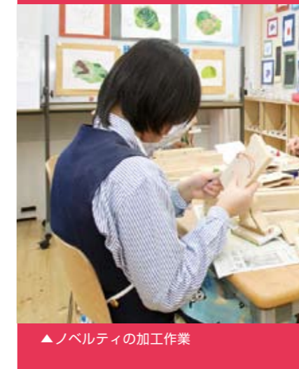
▶ ノベルティの加工作業