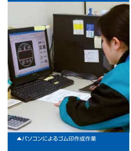
▶ パソコンによるゴム印作成作業

社団法人シルバーサービス振興会では、障害者自立支援法の理念に基づき、障害者の自立へ向けた雇用を推進するため、特に今後急速な成長・拡大が見込まれるシルバーサービス関連の企業を中心に、シンポジウムの開催等さまざまな普及啓発の取り組みを行っております。本リーフレットはこの取り組みの一環として、厚生労働省の障害者保健福祉推進事業(平成19年度)により作成されたものです。