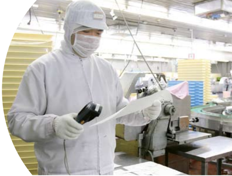
▲精肉加工センターでの就労風景

を意識できること」…「いらっしゃいます」と言えるかどうか。 ②一人でも安全に作業が出来ること…危険の予防 ③トレーニングを通じて作業習熟(上達)が見込めること…本人への動機付けをし、定着を図るために必要。 ④体調が安定していること…服薬など健康管理が自己でできる。