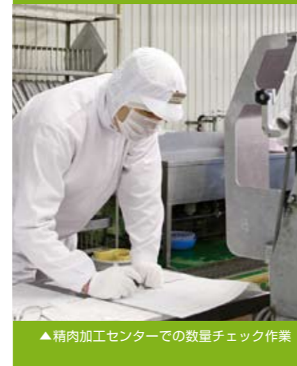
▶ 精肉加工センターでの数量チェック作業