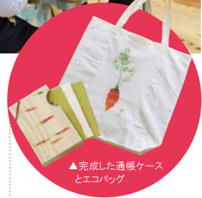
▲完成した通帳ケースとエコバッグ

②既存業務の中で さらに「チャレンジド」では、銀行および関連会社において、知的障害者ができる業務の洗い出しと集約を行い、名刺・伝票類の印刷、入金票のゴム印押し等や冊子、パンフレットの封入発送業務等の多様な業務を行っています。