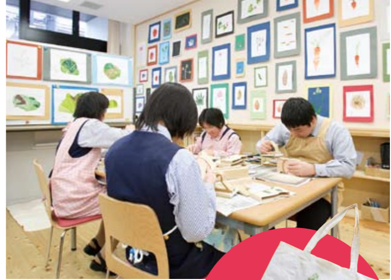
▲ノベルティを作成している風景

慈善事業ではなく、労働の対価として賃金を得、自立して生活できる環境をつくるため、次のことを行いました。