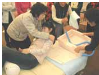
寝たきりのお客様へのシャンプー

美容室内及び訪問美容の際の施設や在宅など、施術をする場面ごとに、具体的な対応方法や介助方法について、実技指導を通して学習します。