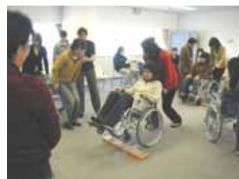
車いすのお客様への接客・援助

女性のおしゃれ心は変わらないものです。高齢者を美しくするための、実践的なメイク等を学習します。