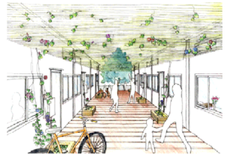
(上) ウッドデッキイメージ

などが配置される予定となっており、仮設住宅入居者の生活に資する機能を一体的に整備している。